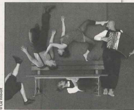
«Banc public», du cirque chorégraphié par la Cie Virevolt, le 11 juillet.

Un banc, un mât chinois et un accordéon suffisent à la compagnie Virevolt pour vous entraîner dans son univers tendre et ingénu. Acrobates et musiciens s'amuse de cet espace public imaginaire, le conquièrent, se l'approprient, s'en dépossèdent, au fur et à mesure des jeux qui s'installent entre eux. Ça grimpe, ça saute, ça fait semblant de tomber, ça se chamaille et ça virevolte bien évidemment. Les saynètes s'enchaînent sans véritable histoire, nous donnant à voir de jolis numéros de portés, de mains à mains, de voltiges... qui s'inspirent de petits moments du quotidien. C'est exécuté proprement, mais fragile dans les enchaînements. Quoi qu'il en soit, on passe un agréable moment, fait de légèreté et de délicatesse. Vendredi 11 juillet, à 21 h 30, dans la cour de l'école, aux Adrets. 04 76 71 16 48. De 8 à 12 euros. Dès 6 ans.