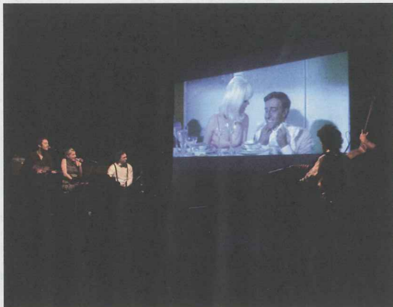
«The party», un ciné-concert signé No Mad 7, le 8 juillet.