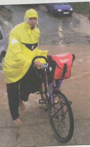
«Apartés», cirque et danse, par la Cie Singulière, les 4 et 5 juillet.